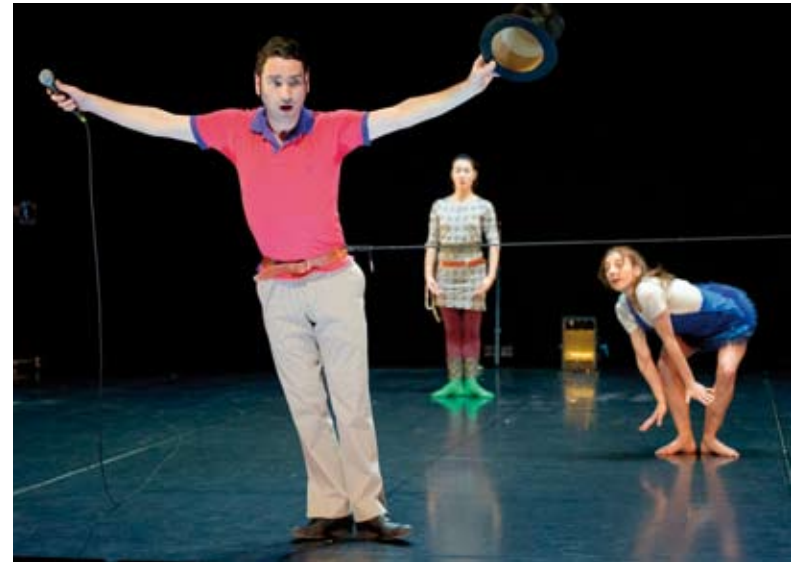
Cuisses de grenouille