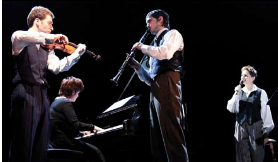
Haïm, à la lumière d'un violon

Spectacle présenté en collaboration avec la ville d'Arles