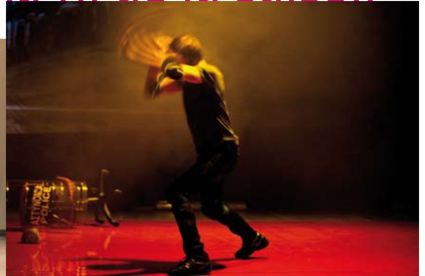
Alexis. Une tragédie grecque