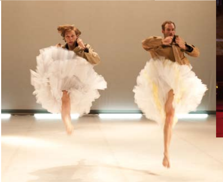
Pudique Acide / extasis