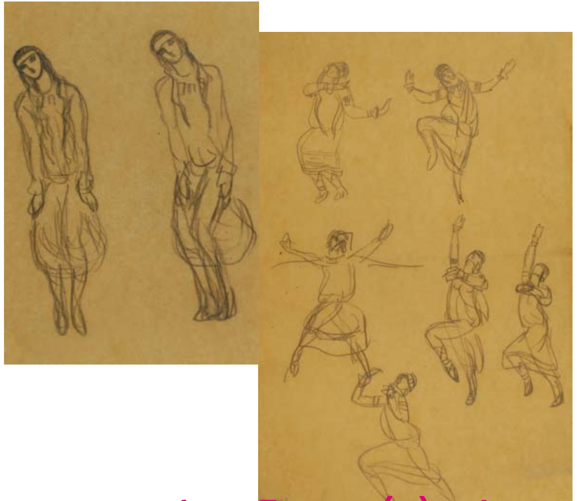
Dessin de la danse sacrée, Valentine Cross-Hugo, 1913