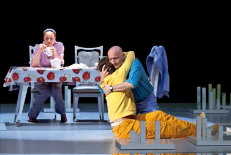
Lignes de faille