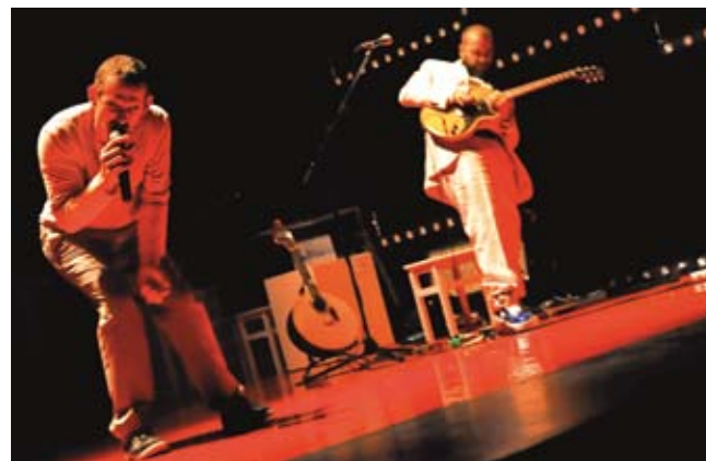
Le GdRA transfigure en jeux au plateau l'ordinaire de tout un chacun, il questionne et montre ainsi des «vifs».